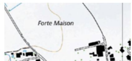
Figure 8 - Extrait de cartes et plans cadastraux