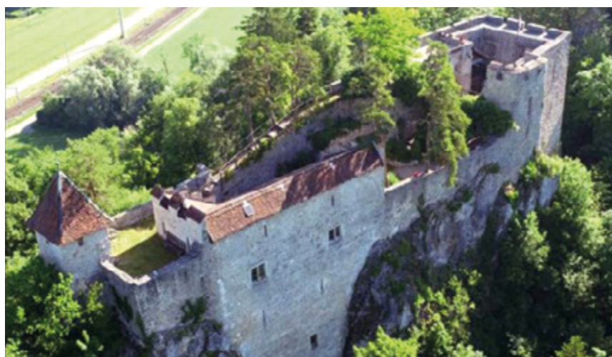
Figure 2 - Vue aérienne du château

Le lieu est depuis 1920 la propriété de la Société des Amis du Château de Soyhières (SACS). L'association a pour but de restaurer le château (en ruine à l'époque - figure 3), avec des travaux de maintien et de reconstitutions (figure 4). Le château peut être visité (voir sur le site) 2 . L'accès se fait par Bellerive au sud (chemin rural et sentier) ou plus aisément par le nord (escaliers surplombant la route menant à la ferme Les Orties). L'effort pour arriver au château en vaut la peine, le site étant particulièrement remarquable. 1-5