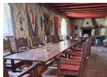
Figure 4 - Intérieur du château