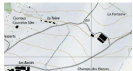
Figure 7 - Extrait de cartes et plans cadastraux

Cité dans un article du Quotidien Jurassien consacré à l'histoire de Courroux-Courcelon, Jean-Pierre Schmidt, qui a étudié les sources précitées, évoque l'existence de trois maisons fortes : La Fortaine, à Courcelon, Forte Maison (à proximité des trois chênes) et Le Jardin du Curé, à Courroux. Cette dernière aurait été détruite en 1356, lors du tremblement de terre déjà cité. 12