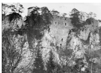
Figure 3 - Le château au 19 e siècle - calotype de Quiquerez © Association du Sentier Auguste Quiquerez