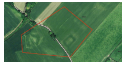
Figure 9 - Photo aérienne de 1998