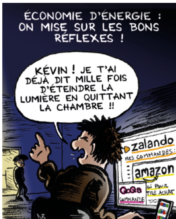
Le commandement de David !