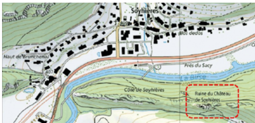
Figure 1 Extrait de carte topographique