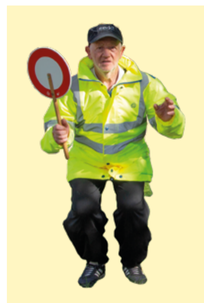
Et en plus il danse pour faire barrage aux contredanses !