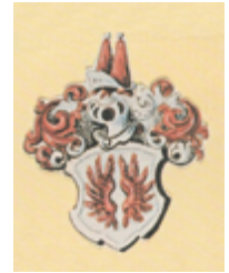
Figure 6 - Armoiries des nobles de Courcelon © Armorial de Quiquerez 8

- complexes et évolutifs - entre cette petite noblesse et l'administration locale (maire) déléguée par le prince-évêque. 9