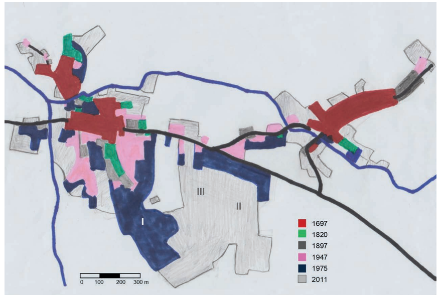
Esquisse sommaire d'après les plans cadastraux et cartes topographiques