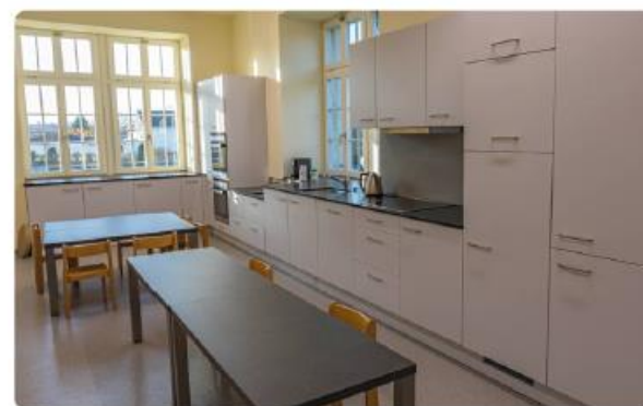
Nouvelle cuisine scolaire