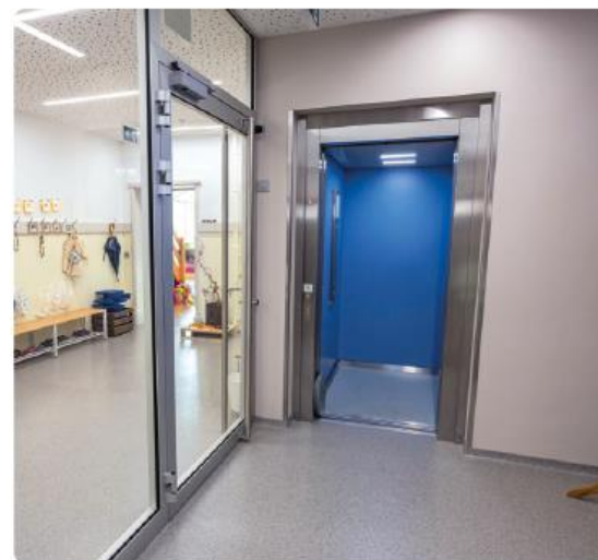
Intégration douce de la cage d'ascenseur