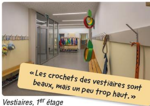
Vestiaires, 1 er étage