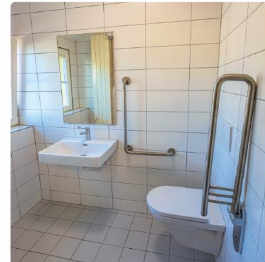
Réalisation de nouveaux WC adaptés