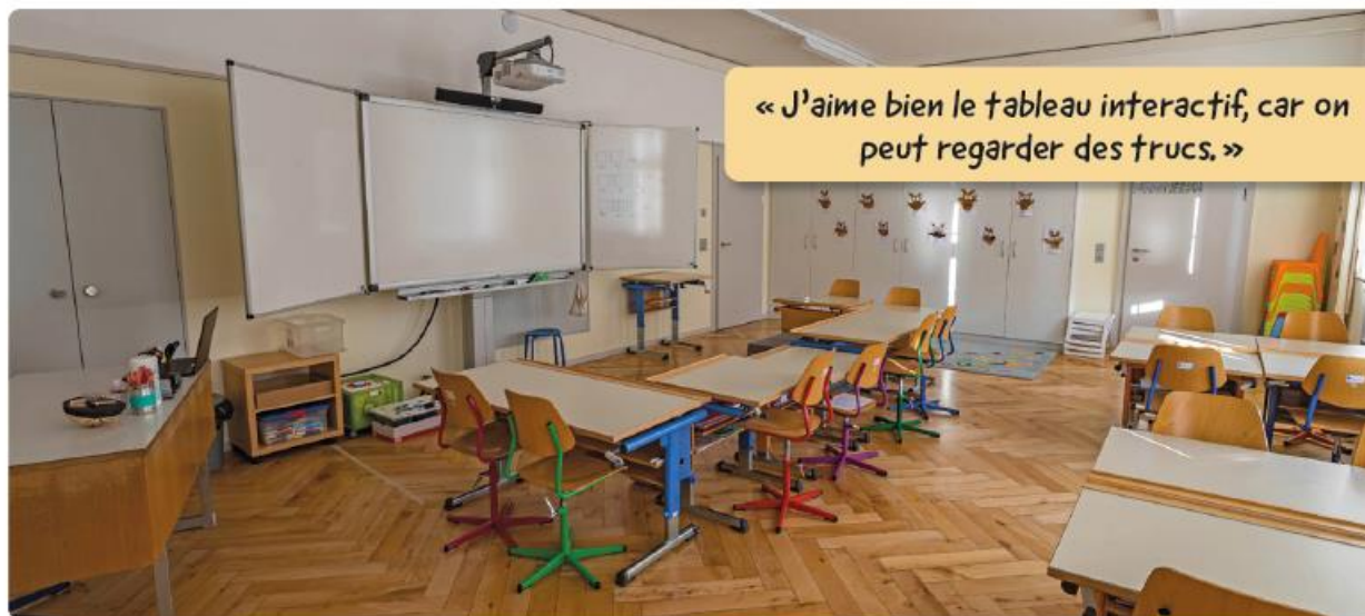
Salle de classe 4P avec tableau interactif, 1 er étage