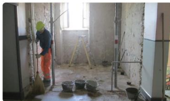
WC Elèves après leur désamiantage