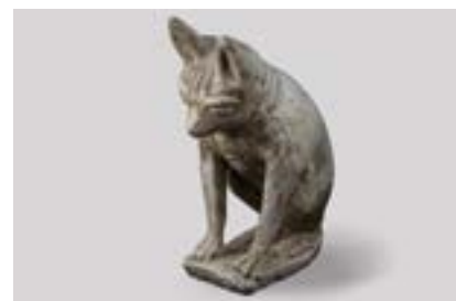
Statuette du loup de Courroux trouvée lors de fouilles archéologiques.

Dans un passé plus récent, on trouve chez Pierre Henry 10 pour Courcelon : le domaine de Sollo, Cello ou Zello et pour Courroux : le domaine de Lutold . Pour Jean-Paul Prongué 11 , c'est un sens évident pour Curtis Leodaldus (domaine de Lütold). Par contre, pour Courcelon, il pense plutôt à domaine de Sawilo .