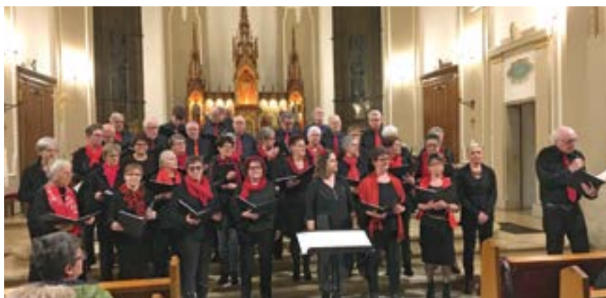
Un centenaire à l'unisson pour la Sainte-Cécile.

Les temps de guerre ralentissent le mouvement mais ne le freinent pas. Avec volonté, le chœur passe au travers de ces instants difficiles pour devenir encore plus fort et chantant. Par leurs voix, tous les membres qui ont pris place à la tribune ont fait s'élever des alléluias et des louanges. Mais la partie profane a aussi sa place et, annuellement, un concert est présenté au public avec la particularité de lui adjoindre une partie théâtrale. Après un long temps