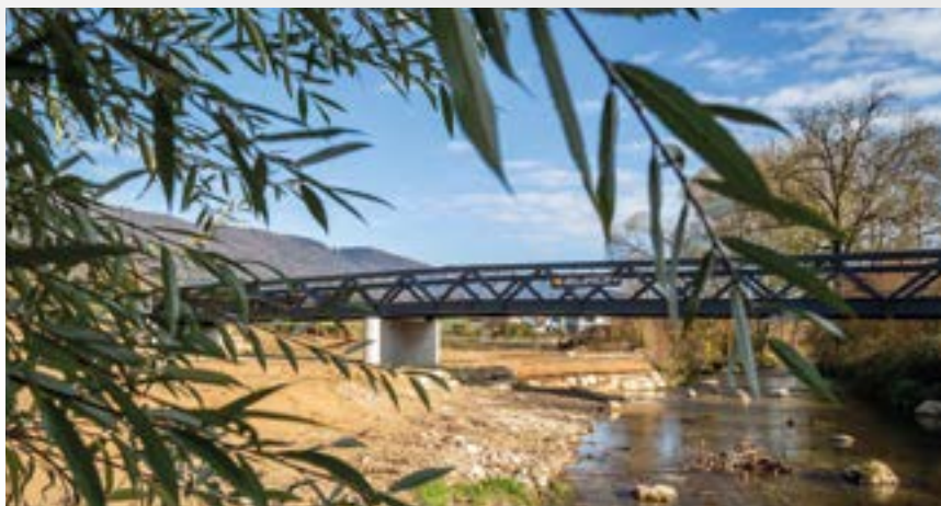
Le nouveau pont de la Pesse sur la Scheulte pourrait aussi symboliser les liens que La Loucarne entend établir avec et entre les habitants de nos villages.