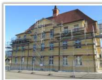
Nouvelle peinture extérieure