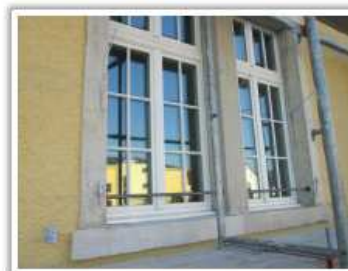
Changement de toutes les fenêtres (triple vitrage) et rénovation des volets protégés par le patrimoine