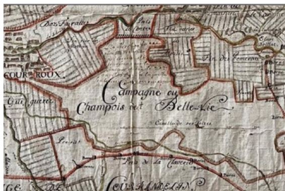
Figure 1 : Extrait plan de Courroux - 1697

Le caractère humide et inculte des lieux apparaît sur la carte de 1850 (fig. 2) et dans les lieux-dits Les Maichières ou Les Voites A . Les anciens utilisaient également les terres de Grand-Marais et Pâturage aux Bœufs pour désigner le lieu. 9 En février 1907, 41 citoyens de Courroux-Courcelon adressent au Conseil communal une pétition relative au drainage de la plaine de Bellevie. Constatant que les pourparlers avec la fabrique de sucre d'Aarberg n'ont pas abouti, ils demandent que la commune reprenne cette importante question. L'assemblée communale du 24.03.1907 donne au Conseil communal les pleins pouvoirs pour faire élaborer des plans et devis. Sur proposition du caissier communal, on reporte l'objet en 1908, avec un montant de Fr. 1000.- prévu au budget de la caisse bourgeoise. En juin 1911, le Bureau de génie civil et rural Leuenberger & Hübscher, dont le siège est à Berne, remet au Conseil communal, avec copies au Canton de Berne et à la Confédération, un Projet d'amélioration de la plaine de Bellevie . L'étude, qui servira de base pour les travaux ultérieurs, concerne l'ensemble du territoire (191 ha), avec un débordement sur les communes de Courrendlin et Vicques (fig. 3). 1