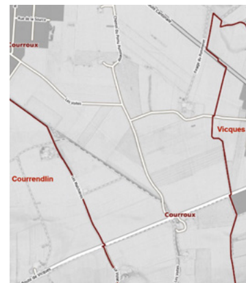
Figure 3 : Extrait carte avec limites communales © SIT-Jura

Un syndicat est constitué et un comité est désigné ; le Conseil communal y siège in corpore et le maire (A. Farine) le préside. La lecture des procès-verbaux du comité - 34 séances en 1919 - et des assemblées communales montre la complexité et l'ampleur du défi. Le syndicat a obtenu des autorités cantonales et fédérales une approche par sections, avec une première étape (132 ha) sans la partie sud (secteur Les Voites, drainé en 1923). Les conflits et arbitrages entre les nombreux acteurs concernés jalonnent le déroulement des travaux. 1 Ces derniers débutent en été 1919 et se terminent l'été suivant (fig. 4 & 5). Plus de 80 ouvriers (logés sur place dans des cabanes en bois construites pour l'occasion) creusent les tranchées et installent l'équivalent de 30 kilomètres de tuyaux. Les travaux sont effectués par l'entreprise Th. Moser, de Nidau (qui a réalisé le drainage de La Communance à Delémont), sous la surveillance technique du Bureau de génie civil Lévy & Masset, de Delémont. Des chômeurs sont engagés en 1921 et 1922 pour des travaux mandatés par la commune. B