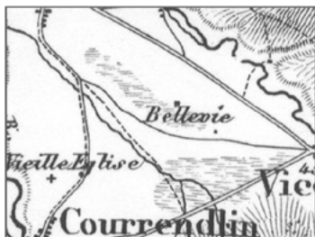
Figure 2 : Extrait carte Dufour - 1850

En septembre 1915, le Journal du Jura consacre deux articles pour fustiger une intolérable négligence due à l'indifférence, à l'égoïsme et à l'invincible routine [...]. Il incite le Conseil exécutif (BE) à prendre des mesures radicales et énergiques [...]. Une corporation, pas plus qu'un particulier, n'a pas le droit de laisser en friche un aussi vaste terrain, en ce moment où la disette nous fait souffrir, où la famine est peut-être à la porte. 2 En 1917, les autorités cantonales envisagent d'obliger la commune à mettre ces 200 ha en culture. 3 En janvier 1918, un nouvel article, sous le titre Fatale incurie, coupable négligence, demande s'il ne se trouvera pas une autorité, basse ou haute, capable de mettre un terme à ce déplorable scandale. 2