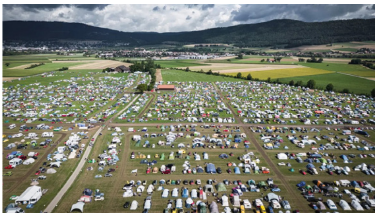
Figure 6 : 24 e Rencontre mondiale 2CV 27.07.2023

Une pétition de l'Aéro-club Bellevie en avril 1973 n'a pas plus de succès, malgré ses 43 signataires. 8 L'assemblée bourgeoise refuse (pour la 4 e fois) de louer une surface permettant de prolonger la piste et d'améliorer les conditions de vol en déplaçant une ligne électrique. On craint cette fois le bruit et une extension future.